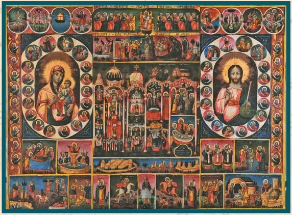
Варненска възрожденска йерусалимия от изложбата „Възрожденски щампи и йерусалимии“