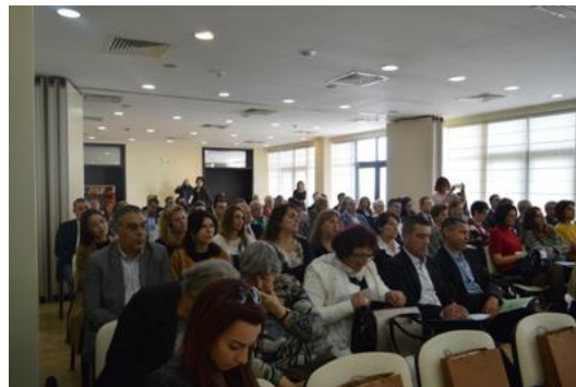
Национална конференция на тема „Общ дневен ред за Черно море“

Регионалният академичен център Бургас беше съорганизатор на Международна конференция „Цифрово представяне и опазване на културно и научно наследство“ – DiPP2018 организирана от Института по математика и информатика на БАН и Регионален исторически музей – Бургас. В рамките на конференцията бяха представени иновативни резултати, изследователски проекти и приложения в областта на цифровизацията, документацията, архивирането, визуализирането и опазването на културното и научното наследство.