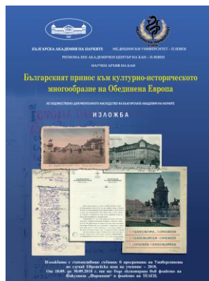
Изложба „Мила Родино”, посветена на живота и делото на Цветан Радославов и изложба „Българският принос в културното наследство на Европа“ експозирани в Медицински Университет, Плевен