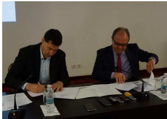
Фото 1 Подписване на меморандум за сътрудничество между Българската академия на науките и Община Пловдив

През 2018 година бяха подписани Меморандуми за сътрудничество между Българска академия на науките и общините Пловдив, Монтана и Сливен, с които се продължава сътрудничеството, заложено в предишните Меморандуми, подписани през 2013 г.