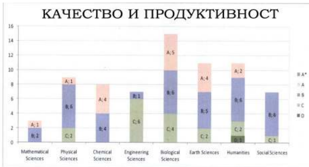
Фигура 3: Разпределение на точките за Качество и Продуктивност в осемте отделения 8