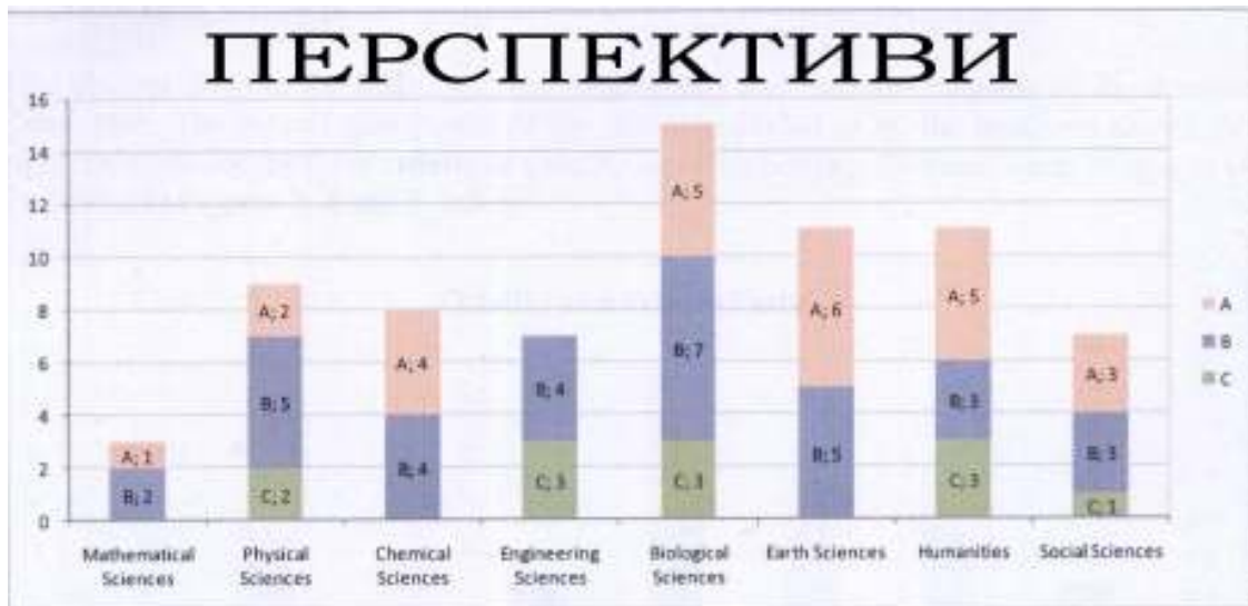
Фигура 5: Разпределение на точките за Перспективи в осемте отделения