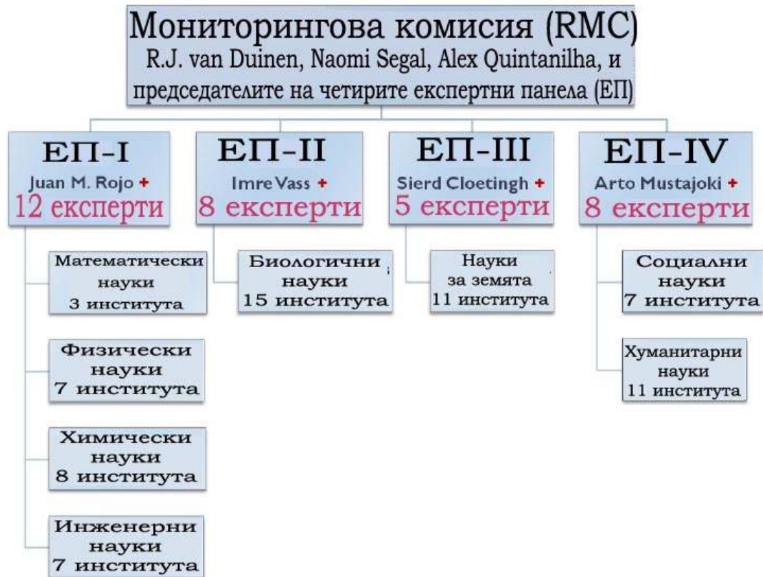
Фигура 1: Обща структура на Комисията за научна оценка на БАН:

техните собствени анализи и обсъждания, отнасящи се и до въпроси, които засягат изследователската работа на по-големи групи от институти, които трябва да бъдат разгледани на равнище БАН или на още по-широко такова (всичко това съставя Част I на документа).